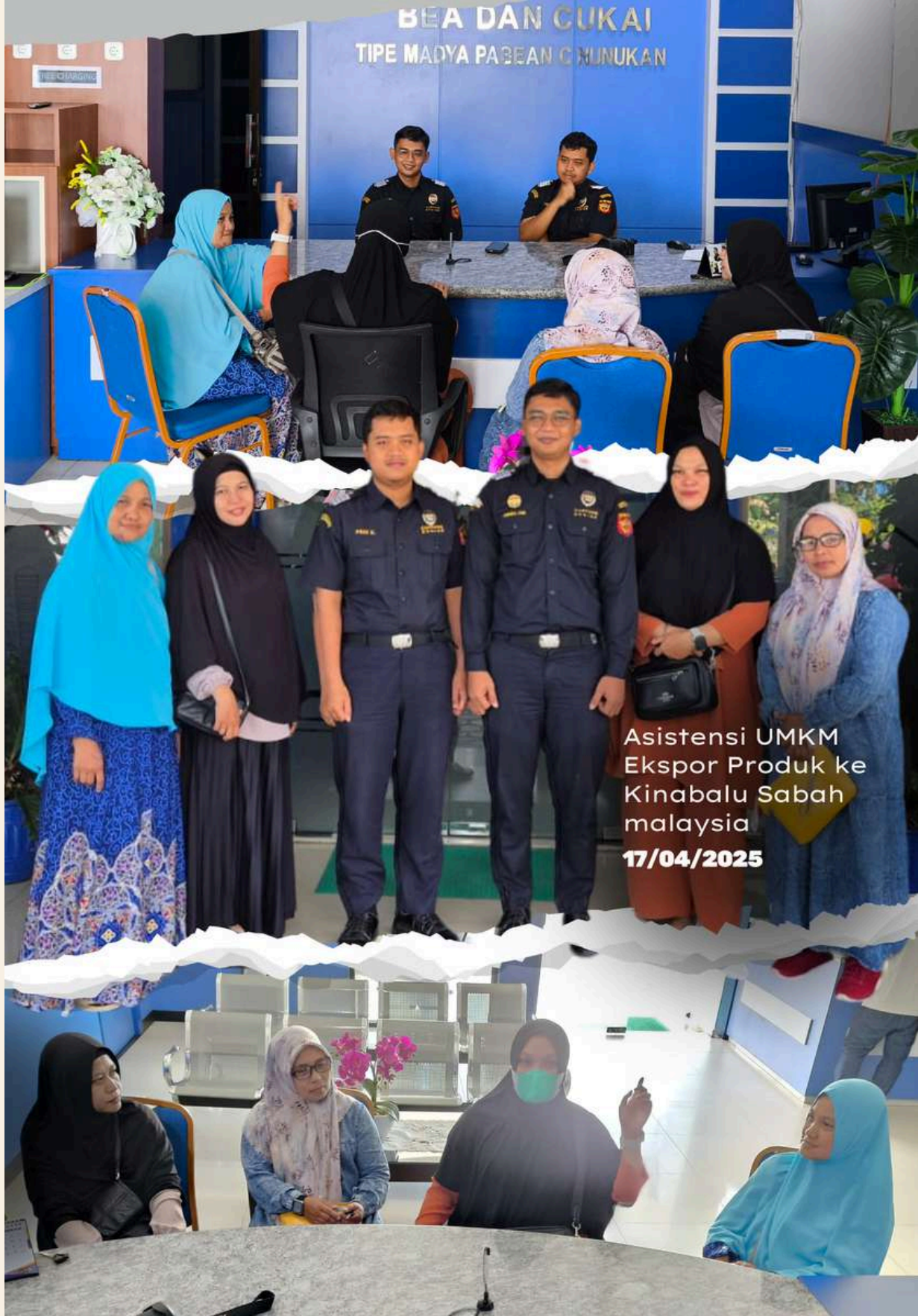
Asistensi UMKM Ekspor Produk ke Kinabalu Sabah malaysia 17/04/2025