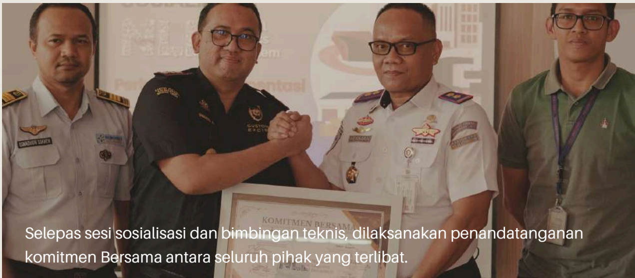
Selepas sesi sosialisasi dan bimbingan teknis, dilaksanakan penandatanganan komitmen Bersama antara seluruh pihak yang terlibat.