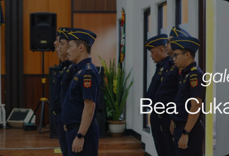
galeri foto Bea Cukai Tarakan