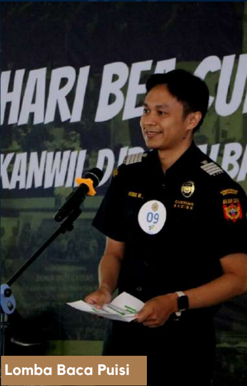
Lomba Baca Puisi