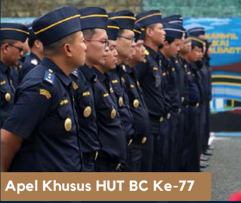
Apel Khusus HUT BC Ke-77