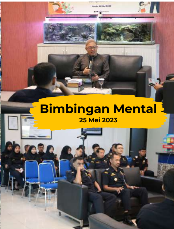
Bimbingan Mental 25 Mei 2023