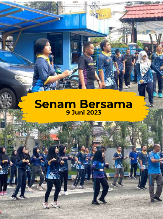
Senam Bersama 9 Juni 2023